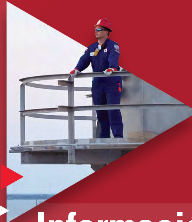
Chrysti Ziegler Auditora General